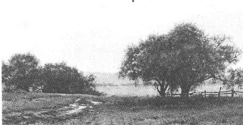
Пейзаж. 1979 г.

Я не хочу сказать, что музей А. Шилова совсем не нужен в Москве, но мне кажется, что его ценность чересчур гипертрофирована. И уж, конечно, не этому музею нужно отводить такое шикарное здание, когда в запасниках ГМИИ им. Пушкина хранятся, и лишь только изредка выставляются, настоящие шедевры.