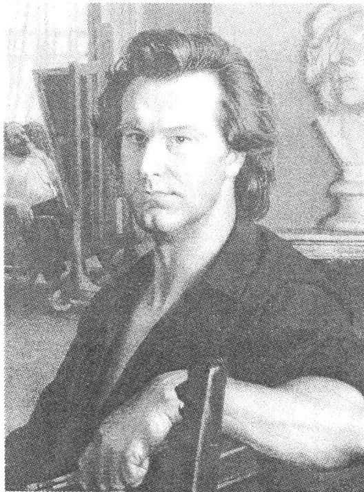
Автопортрет. 1991 г.

Вот портреты "Старый портной", "Деревенский старик", "Зацвел багульник" ... Собственно, ни одного красивого самого по себе предмета, ни единой детали, которую мы могли бы назвать красивой, ни оттенка, ни цвета, ни поворота, ни ... словом, ничего материального, телесно, вещественно красивого здесь нет. И все же полотна Шилова дают зрителю ощущение красоты. Все они прекрасны той удивительной внутренней духовной жизнью, которая побеждает и как бы заслоняет от нас, сни-