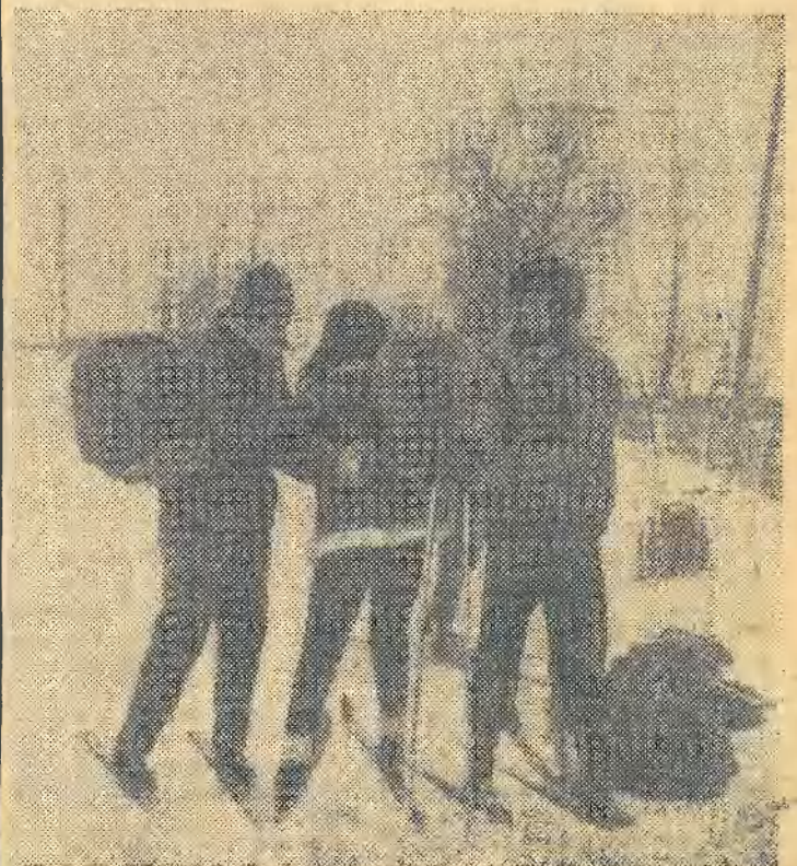
Участники похода по местам боевой славы.