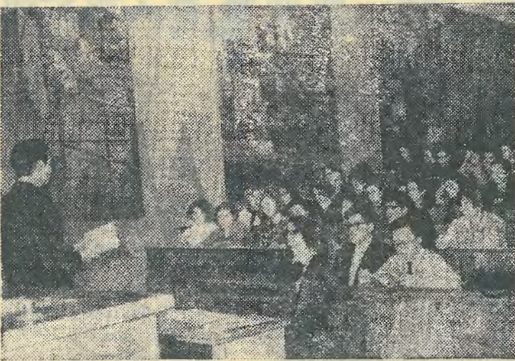
Очередное занятие комсомольского факультета.