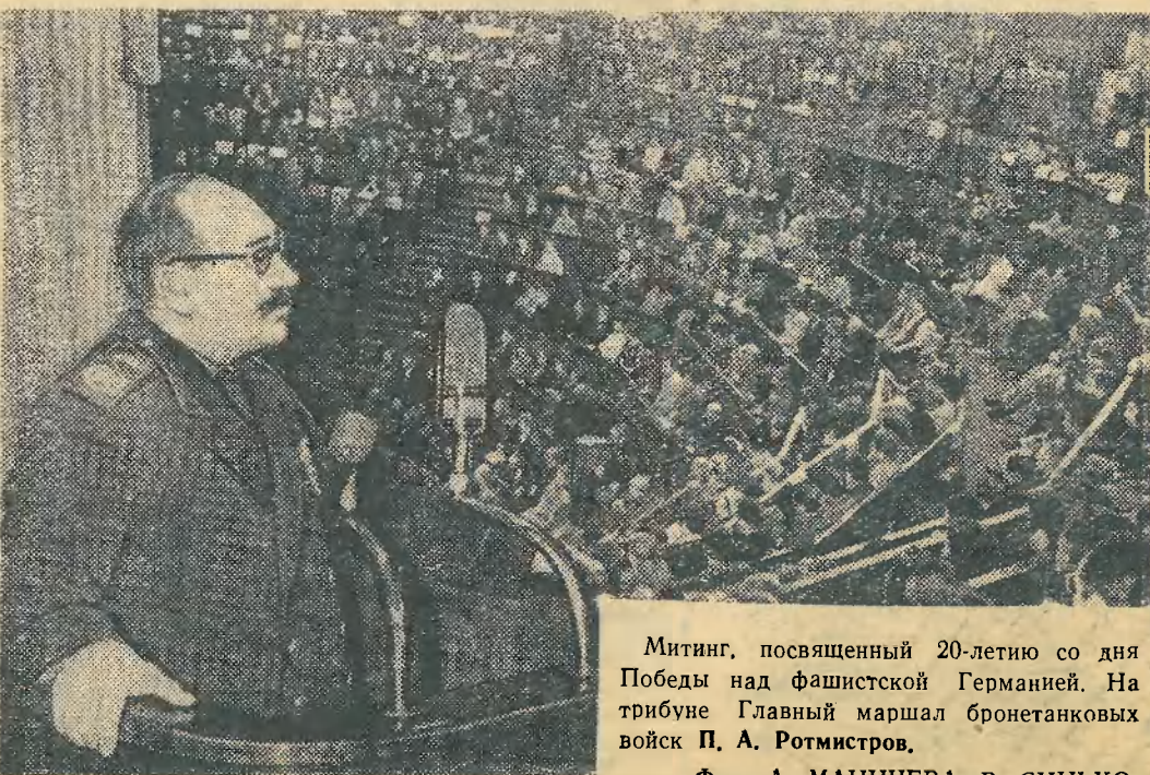
Митинг, посвященный 20-летию со дня Победы над фашистской Германией. На трибуне Главный маршал бронетанковых войск П. А. Ротмистров.