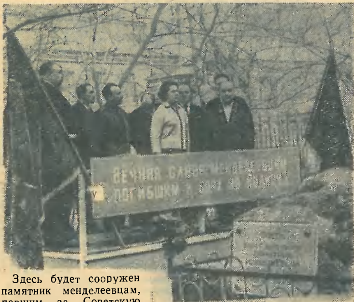
Здесь будет сооружен памятник менделеевцам, павшим за Советскую Родину.

7 мая 1965 года запомнится менделеевцам надолго. В этот день институт торжественно отмечал 20-летие со дня Великой Победы нашего народа над фашистской Германией.