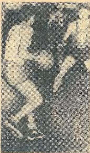
Соревнования по баскетболу на первенство между командами факультетов.

Закончилось первенство института по волейболу среди мужских и женских команд.