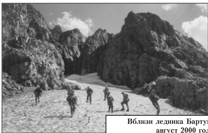
Вблизи ледника Баргуй, август 2000 года