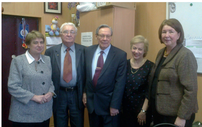
Участники симпозиума памяти проф. Г.А.Ягодина, 2015 г.