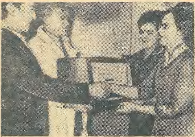
Торжественное вручение награды девушкам из комнаты 44 I корпуса.