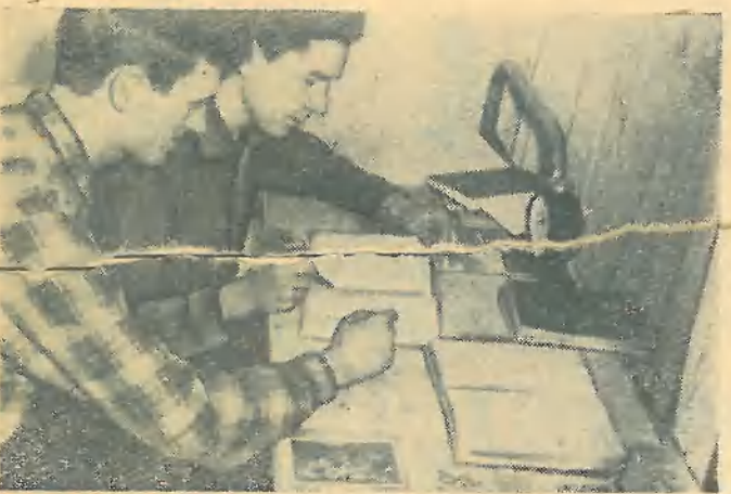
Завтра семинар, необходимо тщательно подготовиться к нему.